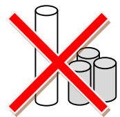
トイレットペーパー ・ラップの芯